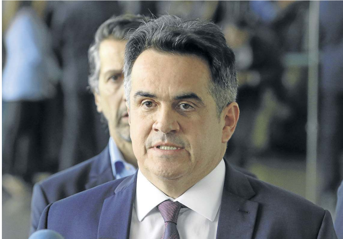
Ciro Nogueira após declaração de Bolsonaro: governo iniciará a transição “quando for provocado”