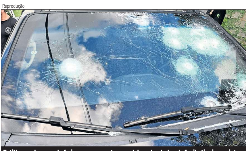
Estilhaços de granada feriram uma agente e um delegado e balas de fuzil atingiram viatura