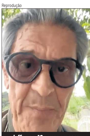
Jefferson: 13 armas em casa