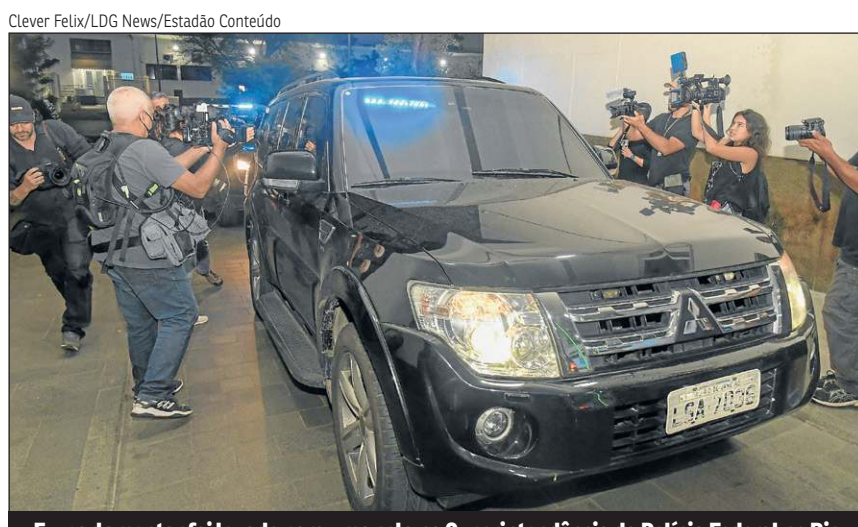
Ex-parlamentar foi levado para uma cela na Superintendência da Polícia Federal no Rio