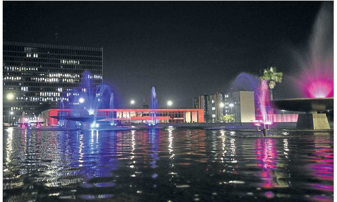
As luzes projetadas no Palácio do Buriti e em outros monumentos de Brasília ficam até o fim do mês