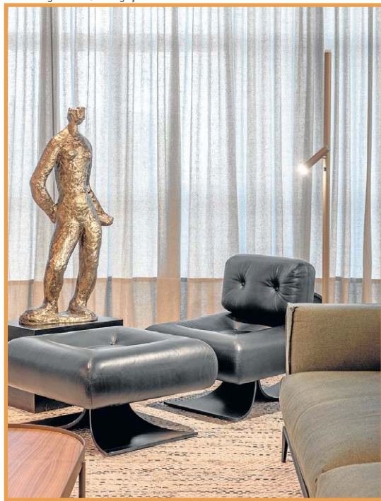
Escultura no espaço criado por Hélyo Albuquerque