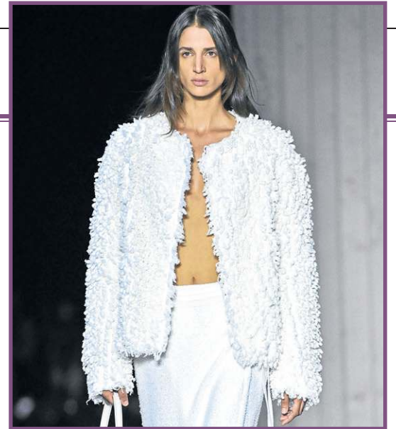
Na semana de moda de Milão, a pelúcia brilhou