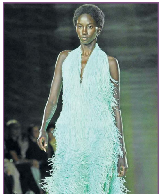
Bottega Veneta's abusou das texturas em Milão