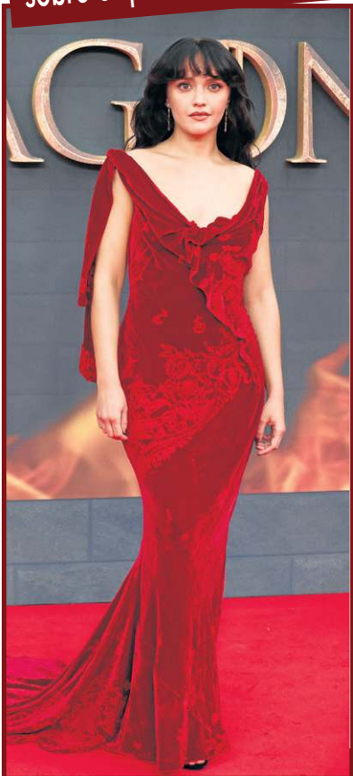
As cores fortes estão em alta, como mostra a atriz Olivia Cooke

Os eventos e as comemorações voltaram com tudo, suscitando a dúvida sobre o que vestir para cada ocasião. Veja dicas de especialistas