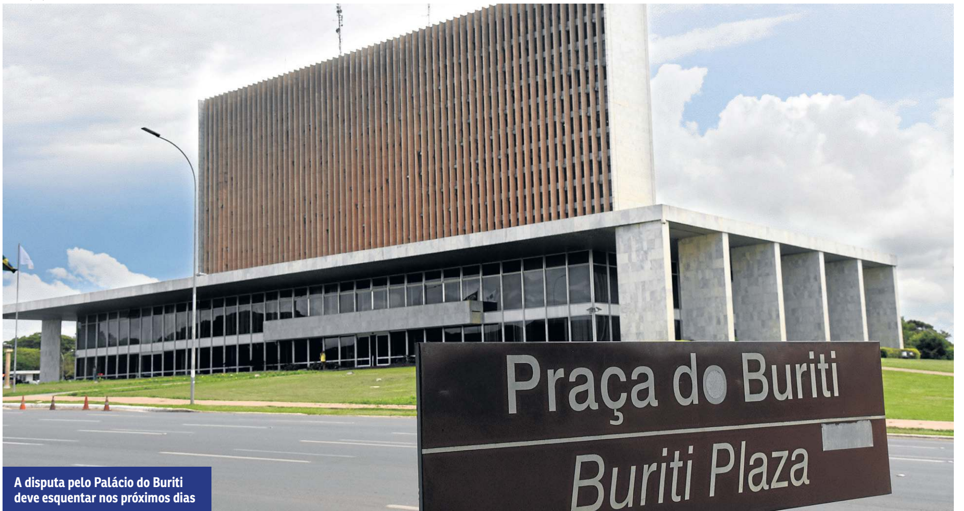
A disputa pelo Palácio do Buriti deve esquentar nos próximos dias