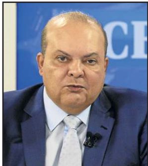
IBANEIS ROCHA MDB