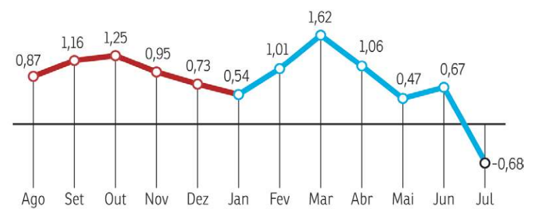
IPCA acumulado em 12 meses (Variação %)