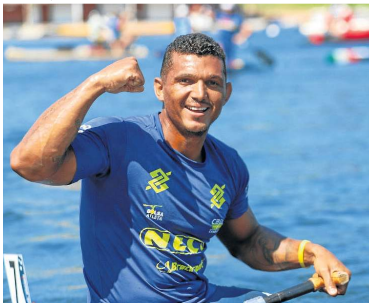
O baiano encerra o Mundial com uma medalha de ouro e uma de prata

a promessa cumprida, ele centra o foco na disputa dos Jogos Olímpicos de Paris 2024.