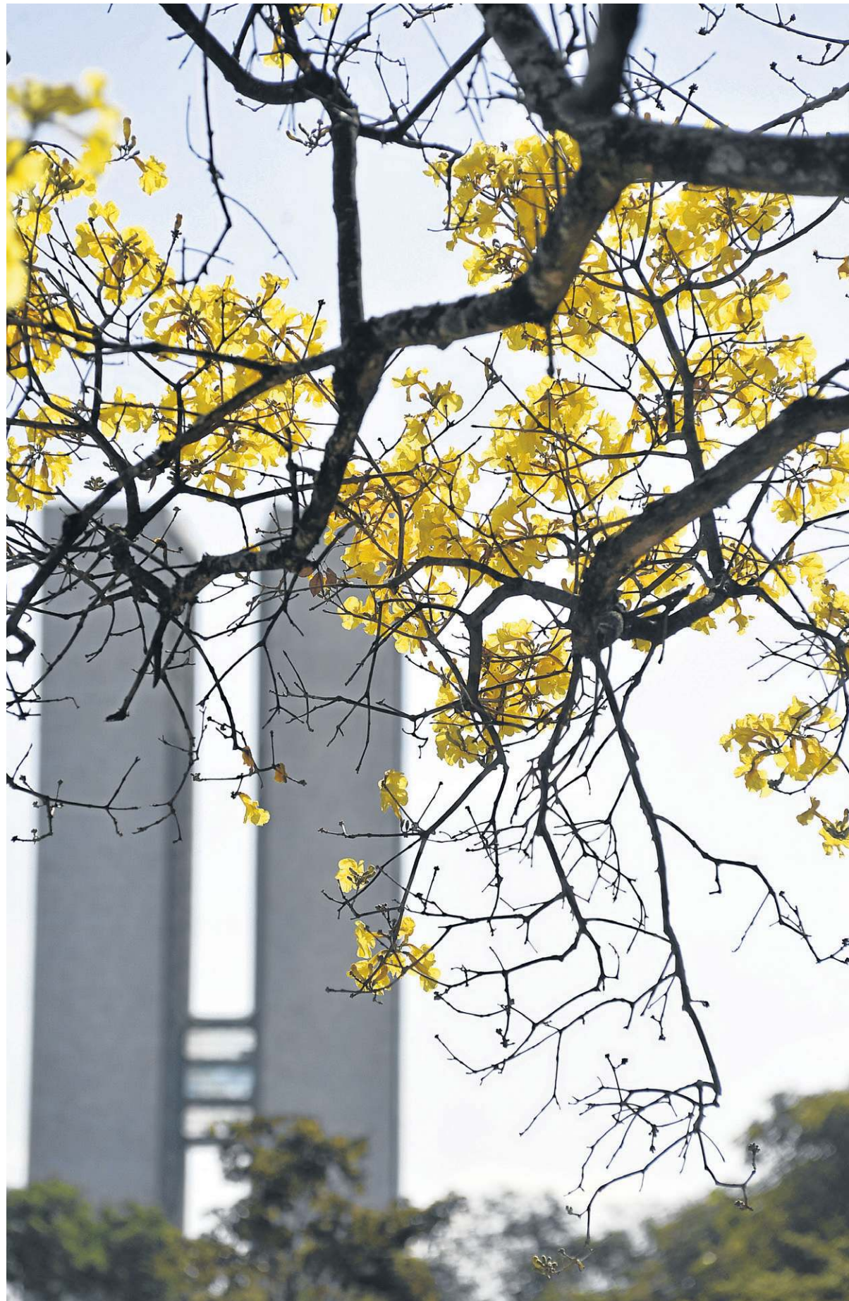
Aos poucos as floradas amarelas começam a despontar, rompendo a aridez da seca que castiga Brasília

pelo tempo em seu coração, algo que jamais vai esquecer.