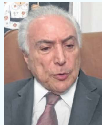
Ex-presidente Michel Temer