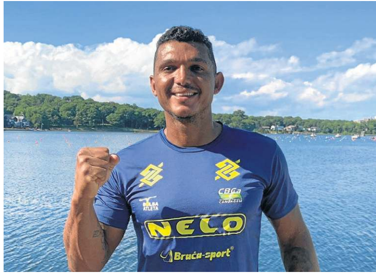
Canoísta brasileiro volta à água hoje na categoria C1 1000 metros