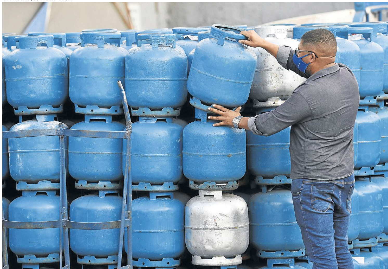
Segundo o governo, cerca de 5,6 milhões de famílias deverão receber a ajuda para comprar gás de cozinha, cujos preços dispararam

referente aos meses de fevereiro a julho, é de R$ 110,47.