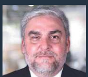
Sílvio Nascimento Presidente da Embratur