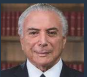
Michel Temer Ex-Presidente da República