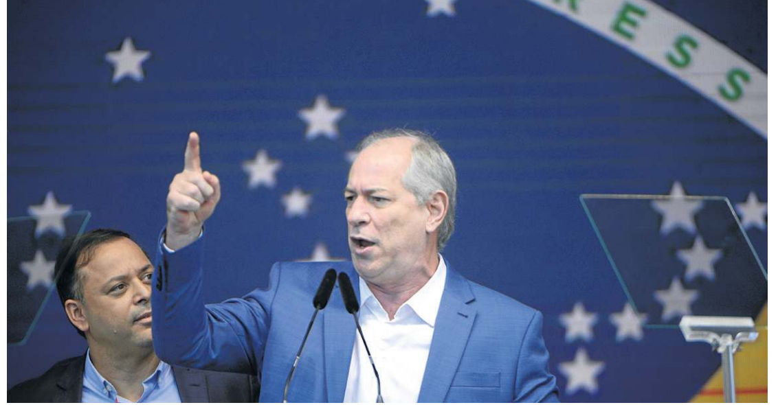
Ciro tenta, pela quarta vez, chegar à Presidência da República: sem alianças nacionais