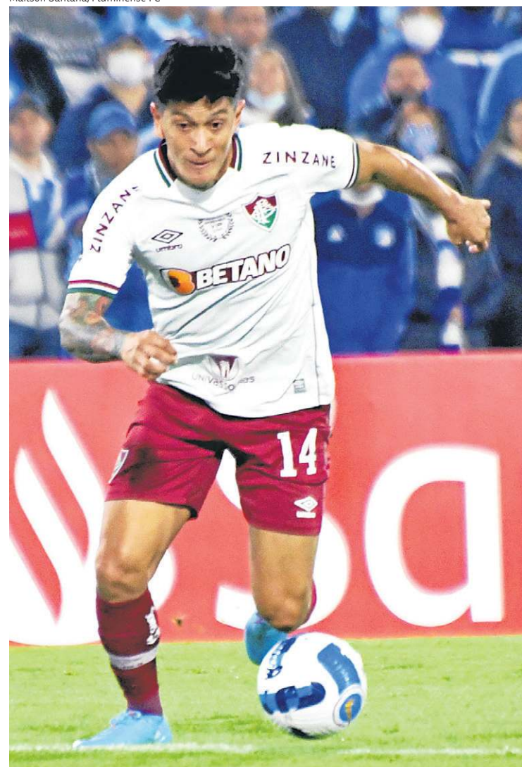
Artilheiro do Brasil em 2022, Cano pode garantir vantagem tricolor