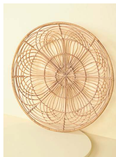
Decorativo Rattan Zahro, da SouQ (R$ 279,29)