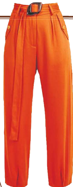
Calça laranja, da Dona Santa (R$ 752)