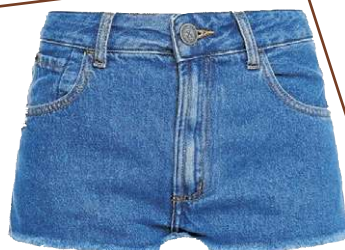
Shorts reto Moroni, da John John (R$ 268)