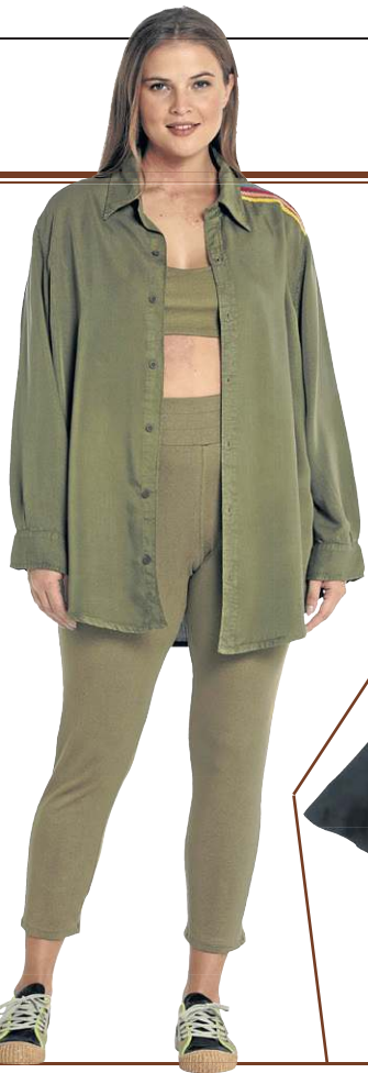
Camisa Classic shape boyfriend, da Havaianas (R$ 229,99)