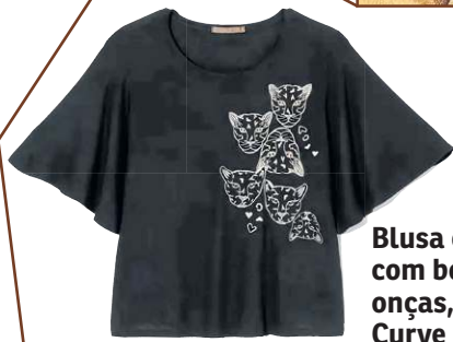
Blusa em viscose com bordado de onças, da Ashua Curve & Plus Size (R$ 99,90)