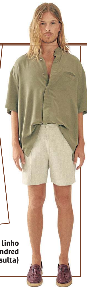
Short Vinco, em linho cru, da Handred (preço sob consulta)