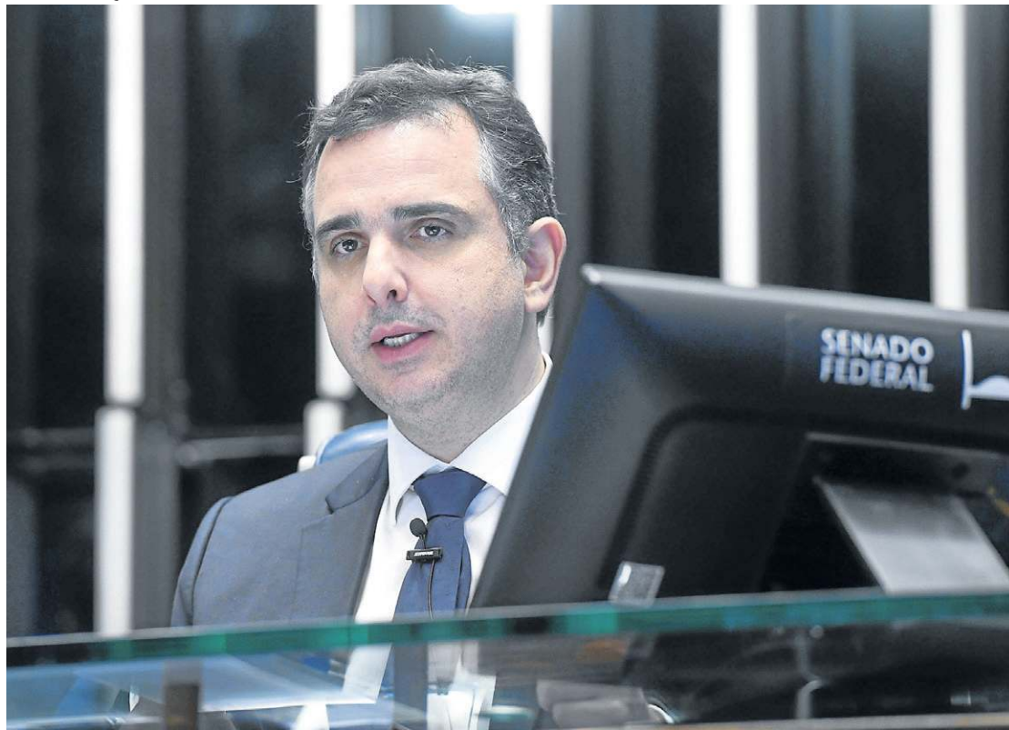
Rodrigo Pacheco leu requerimentos de quatro CPIs para atender governistas e oposição