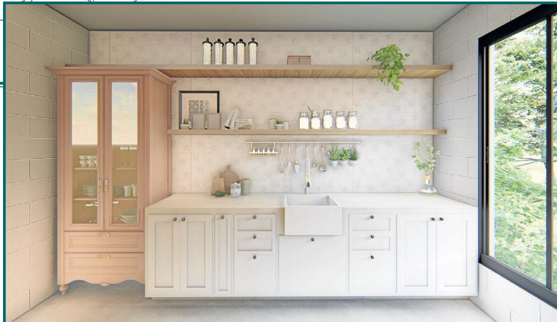
Projeto renderizado de casa com elementos que lembram o estilo "casa de vó": detalhe para a cristaleira