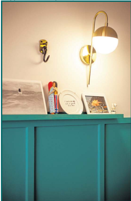
Detalhes ajudam a potencializar uma decoração afetiva