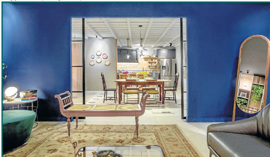
Sala do projeto Canto do tempo e alento, apresentado na CasaCor 2021