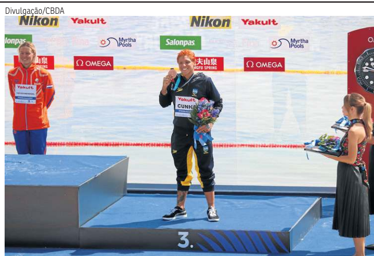
Brasileira já garantiu duas medalhas na edição deste ano, na Hungria