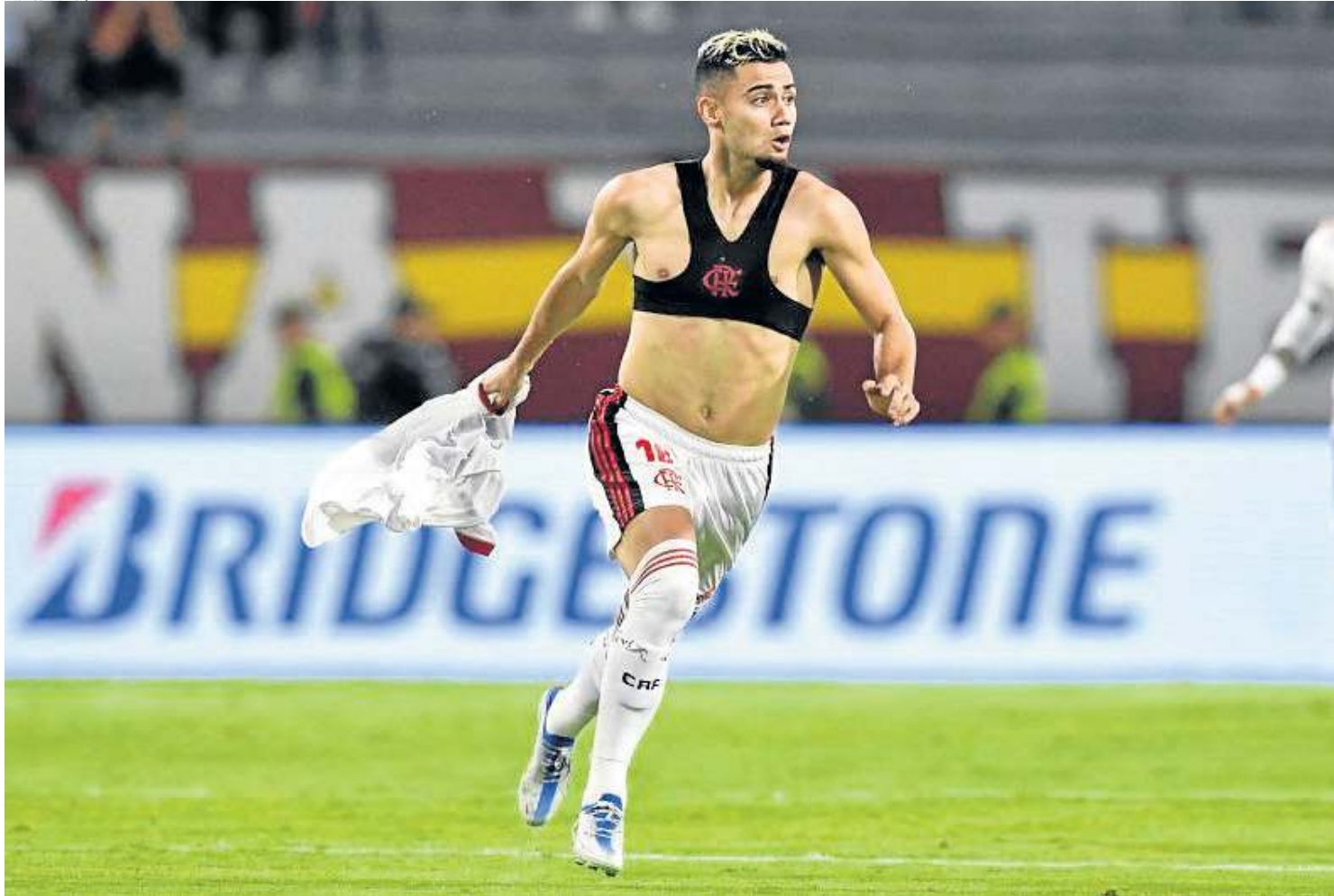
Naquela que pode ter sido a última partida com a camisa rubro-negra, volante protagonista do erro na final de 2021 colocou o time em vantagem