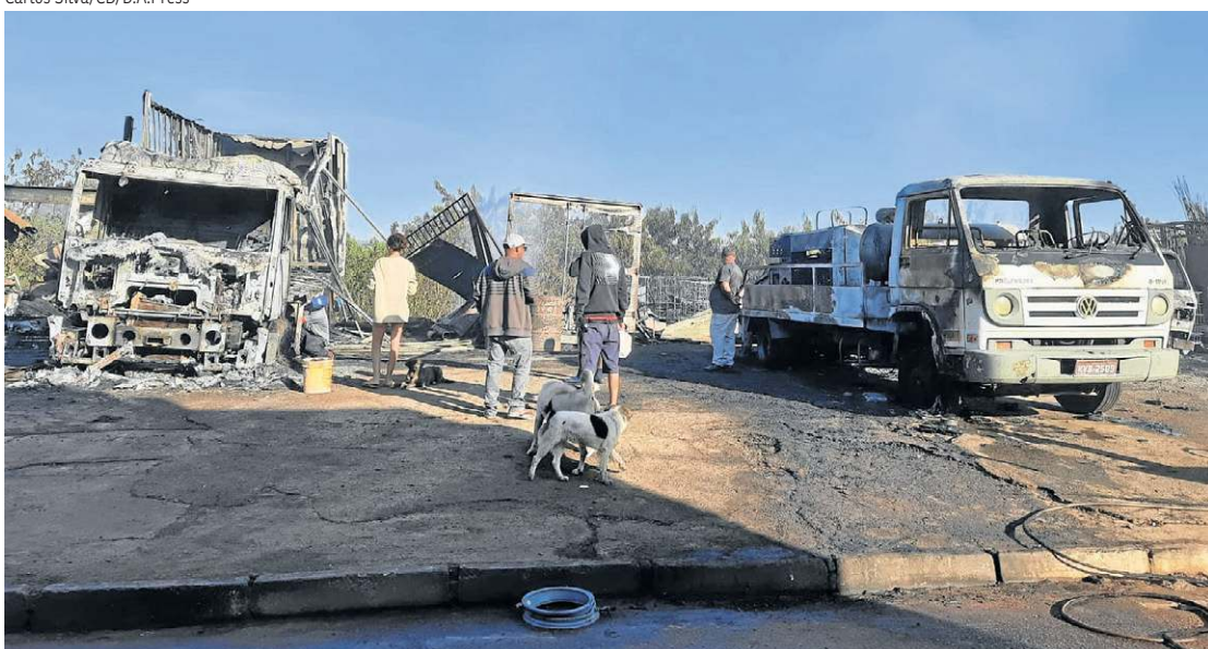
Dono dos caminhões incendiados estima perda de R$ 650 mil. Um dos veículos havia sido adquirido na sexta-feira

que está no local desde a fundação. “Em 30 anos, eu nunca tinha visto nada dessa proporção”, recordou a mulher. “Tentar resolver agora essa situação”, destacou o filho.