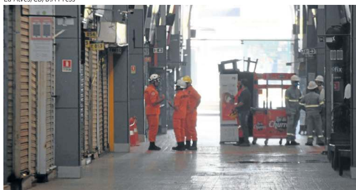
Ao todo, 25 bancas foram atingidas pelo fogo na Feira dos Importados