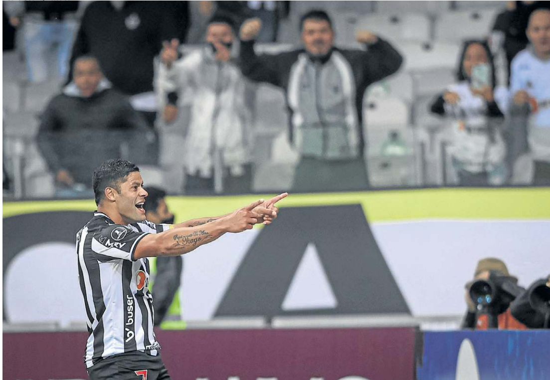
Atacante tem 10 gols pelo clube na competição continental. Com mais dois, ultrapassa a marca de Jô