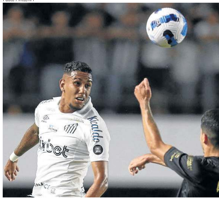
Peixe se classificou por ter feito um gol a mais na fase de grupos