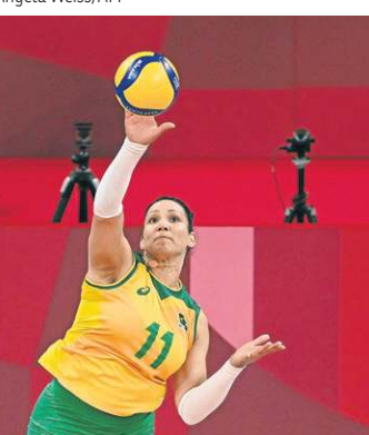
Atleta de Brasília recebeu um gancho de quatro anos no vôlei

porque estou sendo condenada por algo que não fiz. Vamos recorrer ao Plenário para que a justiça seja, de fato, reestabelecida. Respeito, mas não concordo com essa decisão. Lutarei, como sempre fiz, para provar