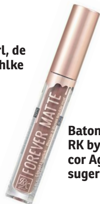
Batom líquido matte RK by KISS NY na cor Aged Rose (preço sugerido de R$ 16,80)