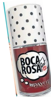
Lip tint Boca Rosa (R$ 39,90)