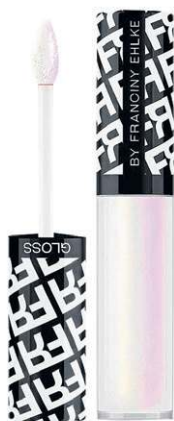
Gloss Fran Glossip Girl, de Franciny Ehlke (R$ 31,90)

Ela observa que, nesta estação, cresce a busca pelo Hydra Gloss Lips. O procedimento é uma alternativa eficaz e prolongada de recuperação, regeneração e hidratação profunda dos lábios. “É um queridinho entre os clientes, pois, além de tratar na clínica, o paciente recebe um gloss de ácido hialurônico para manutenção em casa.”