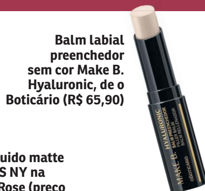
Balm labial preenchedor sem cor Make B. Hyaluronic, de o Boticário (R$ 65,90)