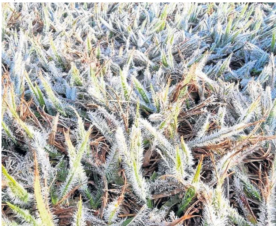
A grama amanheceu ontem coberta por uma fina camada de gelo