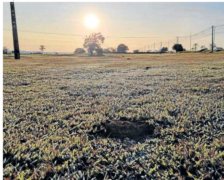
Gramado congelado na Asa Norte. O verde ganha tons esbranquiçados