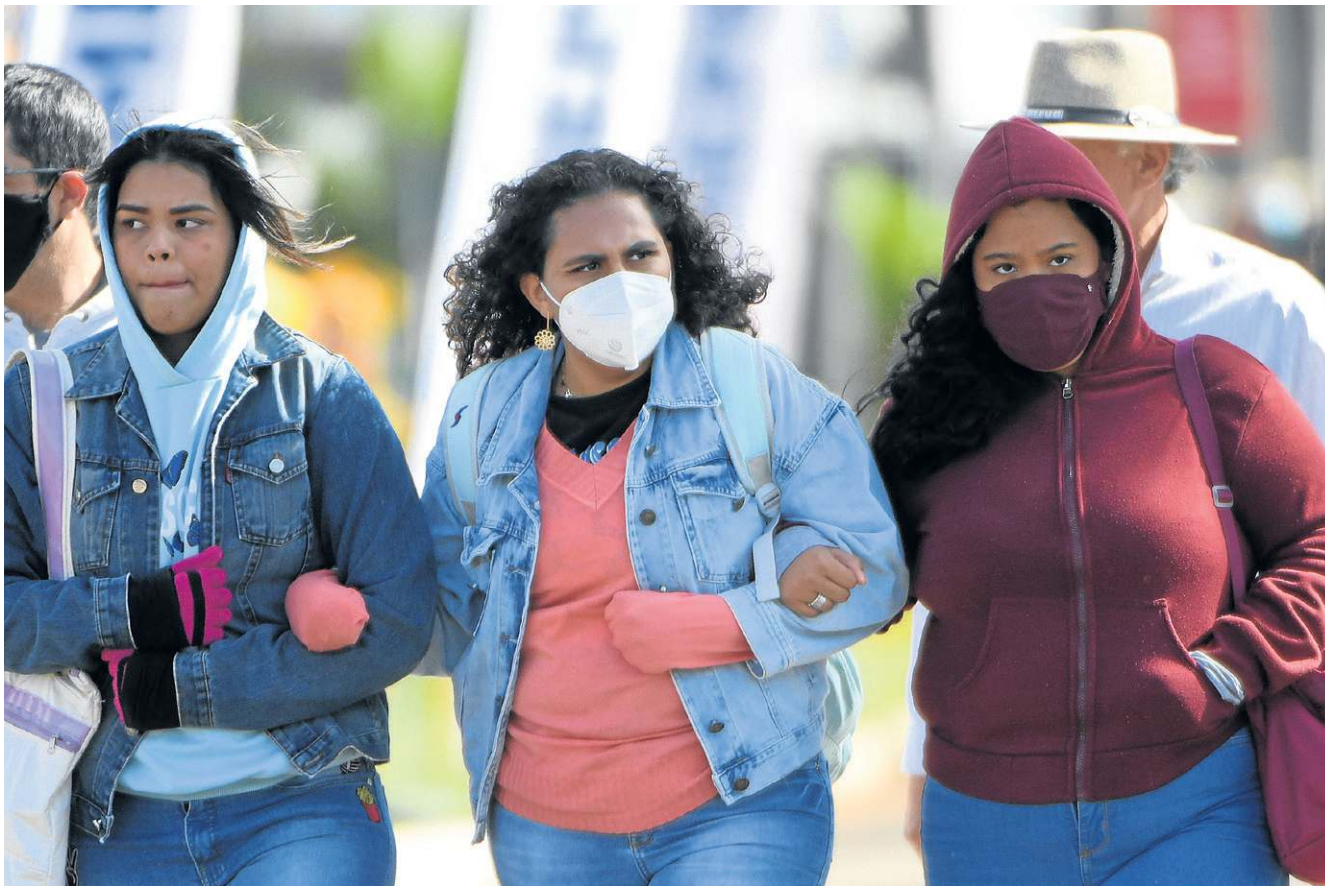
Jaquetas, casacos, gorro e luvas. Vale tudo para se proteger do frio intenso que chegou ao DF nos últimos dias