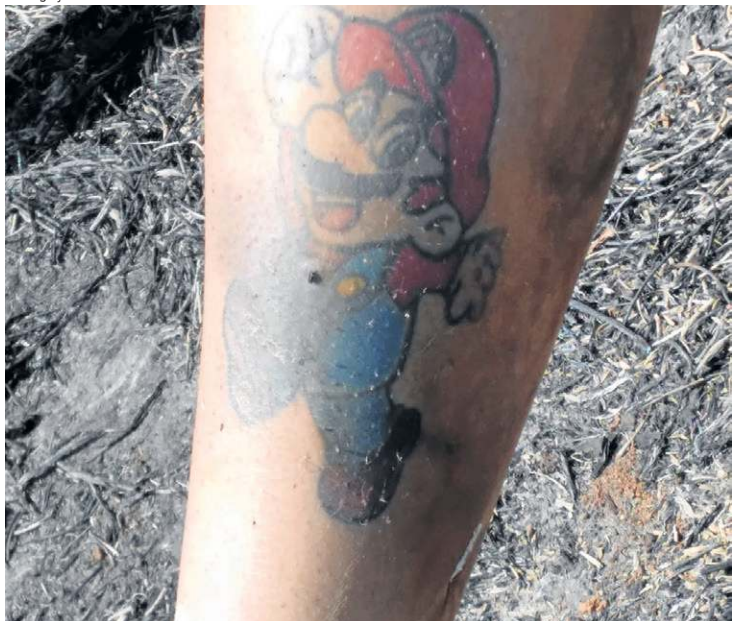
Mulher tinha tatuagens. Polícia pede ajuda para identificação

O corpo de uma mulher foi encontrado parcialmente carbonizada em um região de mata na BR-070, próximo à Escola Técnica e à Chácara Goiás, em Taguatinga, na manhã de ontem. Moradores afirmaram que uma pessoa que estava passeando com um cachorro localizou a vítima, por volta das 7h30, após o animal alertar para a presença de algo.