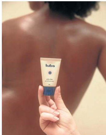
Gel Lubrificante Jambu Vibes, da Lubs (R$ 89)