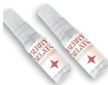
Lubrificantes Xbuds (R$ 69). Linhas Afrodisiac, que aumenta a libido, Energy, que ajuda no cansaço e Relax, para relaxar e estimular o prazer

A Lubs e outras marcas de sexual e skincare começaram a investir nesse tipo de sérum, com vitaminas, melaleuca e até ácido hialurônico encapsulado. A saúde vem em primeiro lugar, o pH e tudo que é usado nos produtos têm a aprovação e os estudos de ginecologistas e dermatologistas.