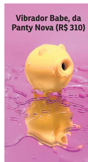
Vibrador Babe, da Panty Nova (R$ 310)