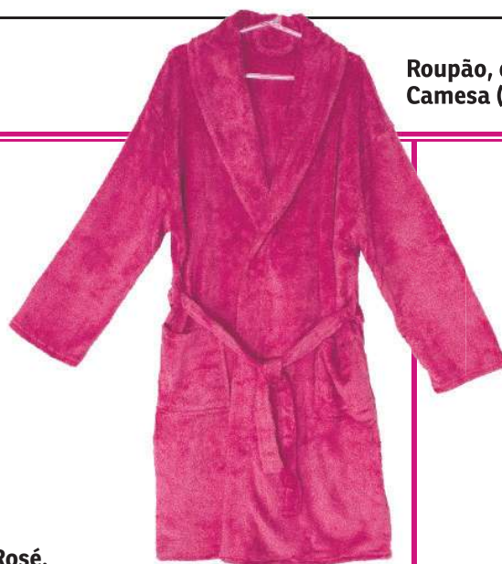
Roupão, da Camesa (R$ 99)