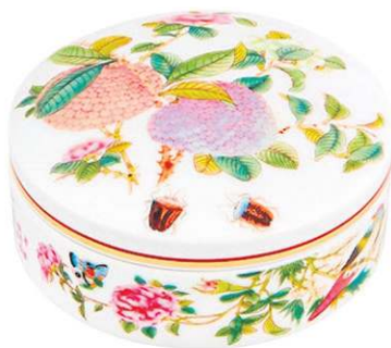
Caixa Regaleira Paço Real, da Matisse Casa (R$ 385)