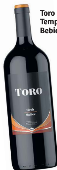
Toro Centenario Tempranillo, da Zanlorenzi Bebidas (R$ 26,90)