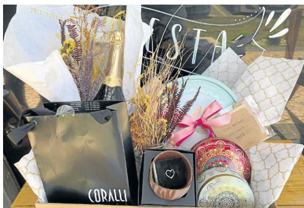
Cesta Rosé, da FSTA & Co (R$ 310)