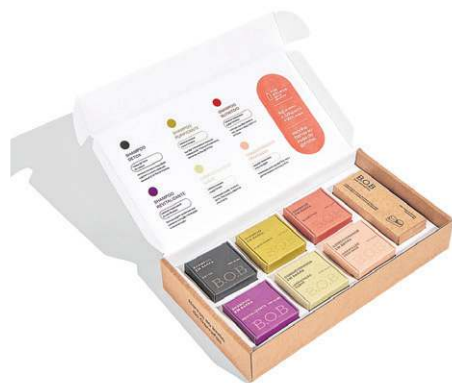
Kit Minis, da B.O.B (R$ 135) Cada barrinha tem um terço da versão tradicional, e os kits podem trazer o xampu Revitalizante, Purificante, Detox ou Nutritivo e o condicionador Hidratação Suave, Hidratação Profunda. Vem também com a Base Elíptica, para apoiar as barrinhas