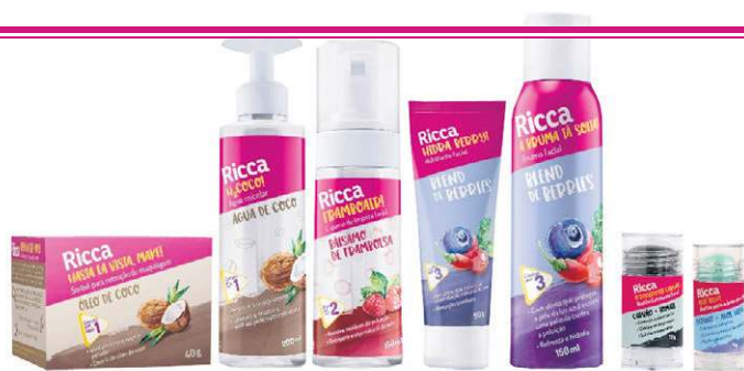
Linha de cuidado faciais diários, da Ricca (R$ 215)