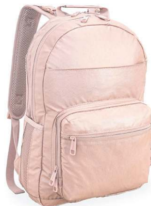
Mochila, da linha Maternidade da Bagaggio (R$ 399,90)