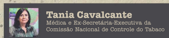
Tania Cavalcante Médica e Ex-Secretária-Executiva da Comissão Nacional de Controle do Tabaco