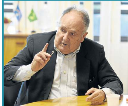
Minervino Júnior/CB/D.A. Press