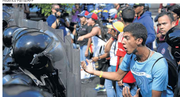
Opositores de Maduro protestam em Caracas, diante de policiais