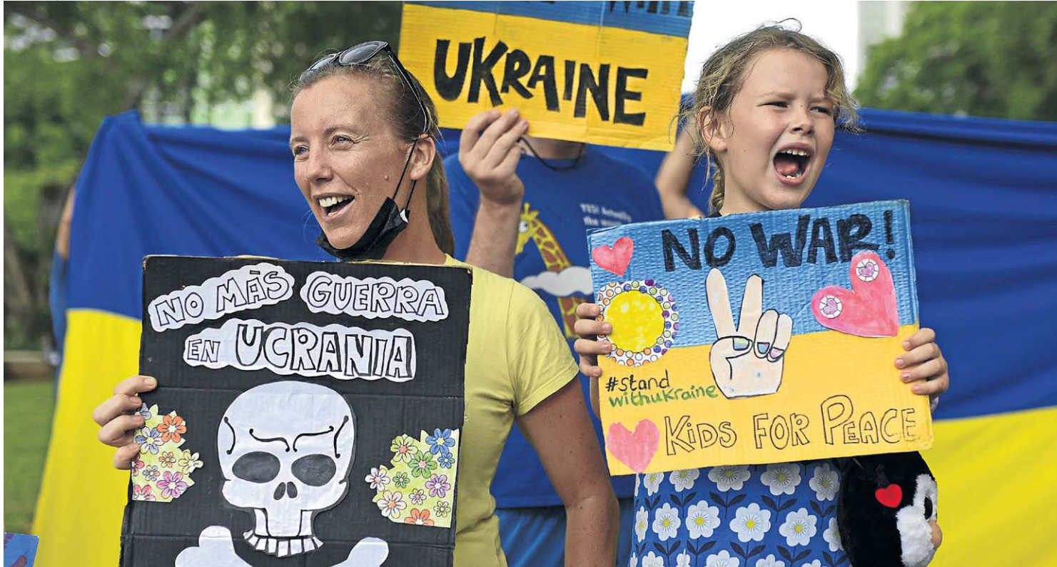
Integrantes da comunidade ucraniana participam de protesto contra a invasão russa, no Parque Urraca, na Cidade do Panamá

democracia — no México e na América Central, 22% não veem a Rússia como uma democracia; 26% na América do Sul; 27% na região Andina; e 24% no Cone Sul. Por faixa etária, 15% dos entrevistados entre 18 e 19 anos disseram que a Rússia não é uma democracia, enquanto 20% a consideram como tal. Dos 30 aos 44 anos, 22% afirmam que o país não é uma democracia, enquanto 34% dos 45 aos 59 anos afirmam o mesmo. A maior parcela dos que não consideram a Rússia uma nação democrática está acima dos 60 anos (46%) — apenas 8% a veem como democrática.