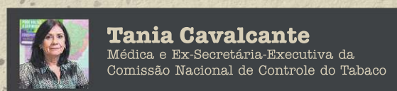
Tania Cavalcante Médica e Ex-Secretária-Executiva da Comissão Nacional de Controle do Tabaco