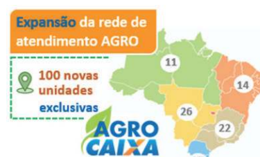
Figura 4 – Expansão da rede agro

Em expansão da estratégia iniciada em maio, a CAIXA ampliou para 100 as novas unidades especializadas em agronegócio, localizadas em todas as regiões do país. As agências contam com equipes capacitadas no agronegócio e dedicadas ao atendimento exclusivo ao produtor rural, com produtos e serviços customizados ao segmento, com isso a CAIXA consolida a estratégia de ampliar sua participação no agronegócio, com foco na agricultura familiar e nos pequenos e médios produtores rurais.