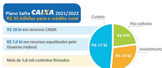
Figura 3 – Plano Safra 21/22

Em sua primeira participação, a CAIXA iniciou o ano safra 2021/2022 com a oferta de R$ 35,0 bilhões em recursos de crédito ao agronegócio. Esse montante contempla R$ 7,0 bilhões em recursos equalizados pelo Governo Federal, além de R$ 28,0 bilhões em recursos CAIXA. A medida visa beneficiar, principalmente, agricultores familiares e pequenos e médios produtores rurais, além de agronegócios e cooperativas. De julho a dezembro de 2021 já foram firmados mais de 5,8 mil contratos.