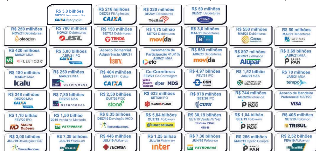
Figura 2 – Operações de Mercado de Capitais

No período de 2019 até dezembro de 2021 a CAIXA realizou mais de R$ 114 bilhões em operações relevantes no mercado de capitais.