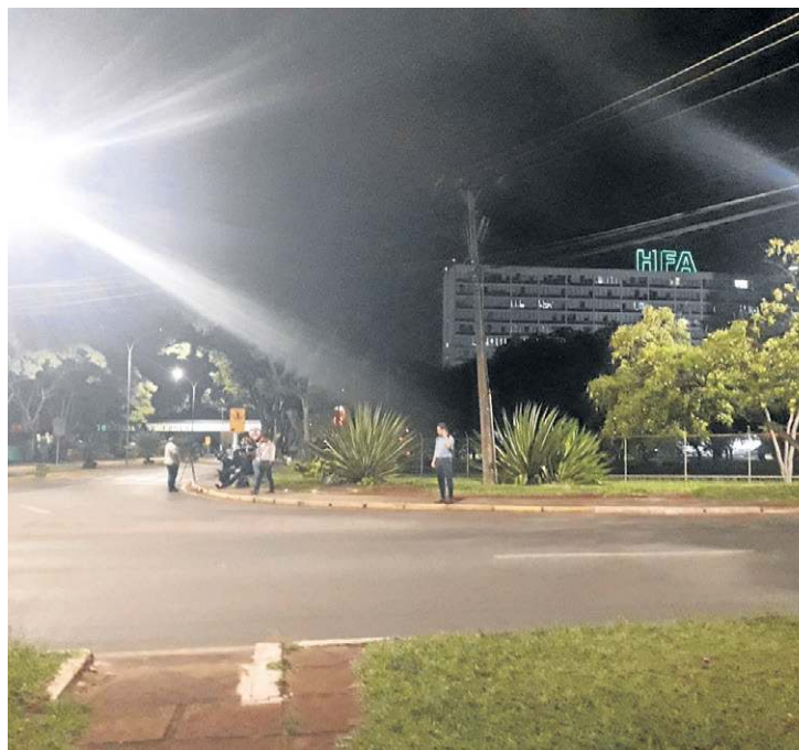
Fachada do HFA: queixas do presidente desde domingo