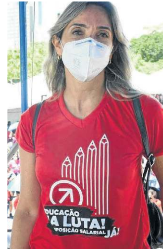
Diretora da Sinpro vem reunindo força para disputa