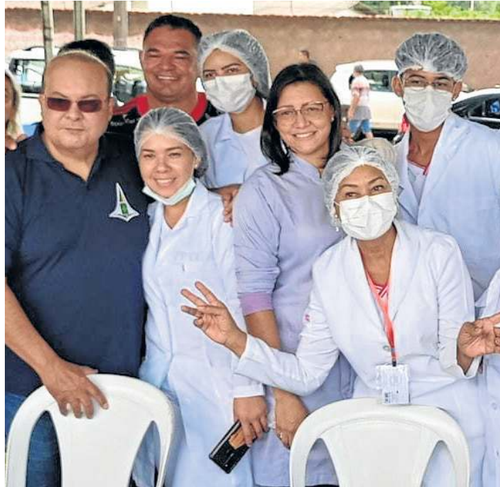
Foi assinada ordem para reforma de unidade de saúde

tentando resolver com a Administração Regional”, explicou.