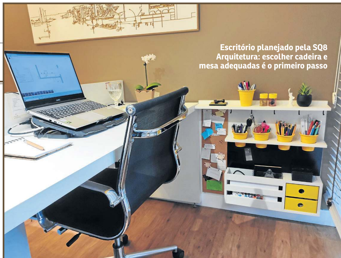
Escritório planejado pela SQ8 Arquitetura: escolher cadeira e mesa adequadas é o primeiro passo

Também é preciso garantir iluminação artificial, como uma luminária ou até a lâmpada do cômodo. Para o trabalho, é adequada uma iluminação