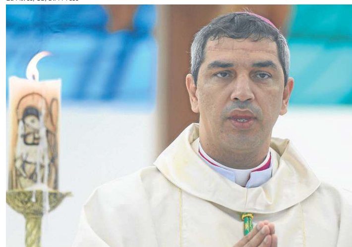
Diocese inclui Forças Armadas, forças auxiliares e capelães