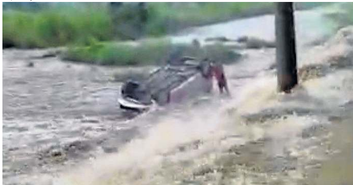
Durante o temporal de ontem, carro foi arrastado na BR-070