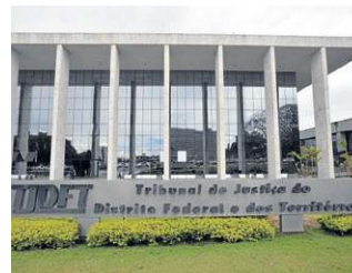
Marcelo Ferreira/CB/D.A Press - 2/4/2018

A Polícia Civil do Estado de São Paulo abriu 250 vagas para a carreira de delegado, que exige o nível superior em direito e habilitação na categoria B. A remuneração inicial é de R$10.382,48. As inscrições estarão abertas a partir de 21 de março e seguem até 28 de abril, por meio do site da Fundação Vunesp.