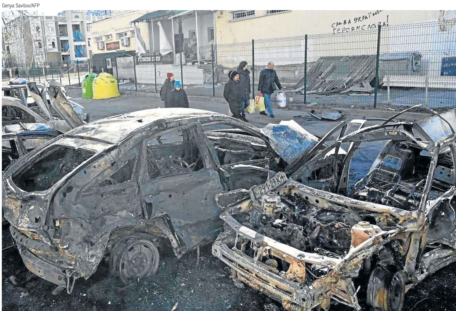
PÁGINAS 2 A 4, 9 E 19. VISÃO DO CORREIO, 10

No campo de batalha, a Rússia aumentou a pressão sobre as duas maiores cidades ucranianas. A capital, Kiev, e Khirkiiv seguem resistindo às poderosas forças de Vladimir Putin, com comboios de tropas especiais que avançam pelo território. Há registros de áreas residenciais atacadas (foto) e civis mortos. A diplomacia de Moscou na ONU — que está reunida em Assembleia Geral para aprovar uma resolução condenando a agressão russa — nega os ataques a civis. Na guerra de imagem, a Ucrânia tem se destacado mais. O presidente, Volodymyr Zelensky, assinou, ontem, pedido de ingresso na União Europeia, em uma estratégia de marketing. No tabuleiro da diplomacia direta, a primeira reunião das equipes de negociação dos dois países em guerra não chegou a nenhum acordo sobre um cessar-fogo. No contexto das sanções econômicas, a Rússia corre o risco de reviver as graves crises dos anos de 1990, com miséria e fome. A retirada de bancos russos do Swift, a rede financeira mundial, levou a uma corrida por saques. O rublo, a moeda russa, teve queda de 30%, os juros passaram de 9,5% para 20% ao ano, a Bolsa de Valores não abriu e Putin proibiu remessas de recursos para o exterior. O Banco Central da Rússia disse que a situação é dramática.