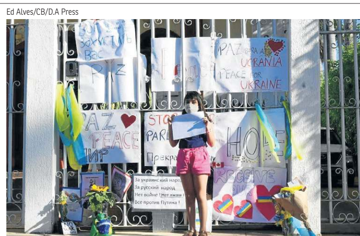
Apoio — Manifestações em Brasília pedem a paz no Leste Europeu