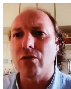
Rodrigo Agostinho Deputado federal (PSB-SP)