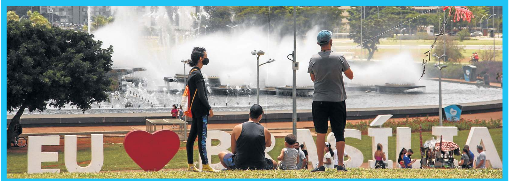
Torre de TV recebeu vários turistas durante o fim de semana