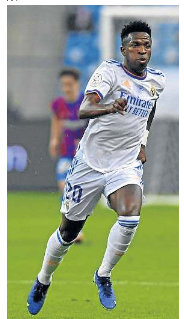
Brasileiro marcou um gol na partida contra o Barcelona