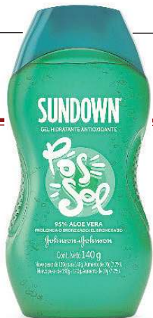
Praia e Piscina Gel Pós Sol, da Sundown (R$ 41,99)