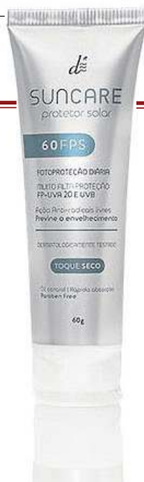
Protetor Solar Alta Proteção Dermo Estetic Suncare, da DR Laser (R$ 136)