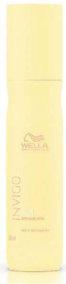
Shampoo Invigo Sun, da Wella Professionals (R$ 95,90)