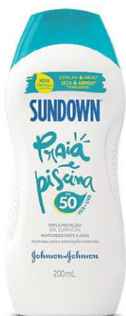
Protetor Solar Praia e Piscina FPS 50, da Sundown (R$ 55,90)