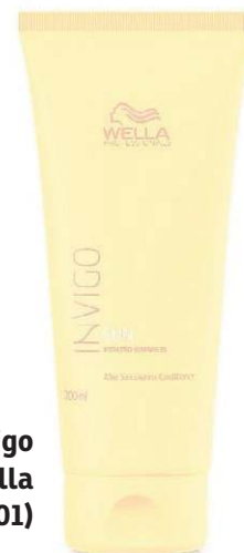
Condicionador Invigo Sun Pós Sol, da Wella Professionals (R$ 101)