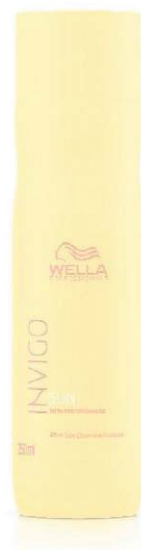
Spray de proteção UV, da Wella Professionals (R$ 106,05)