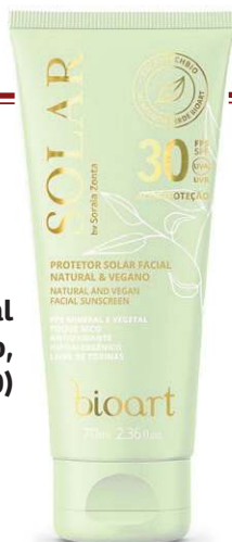
Protetor Solar Facial Natural & Vegano, da Bioart (R$ 170)