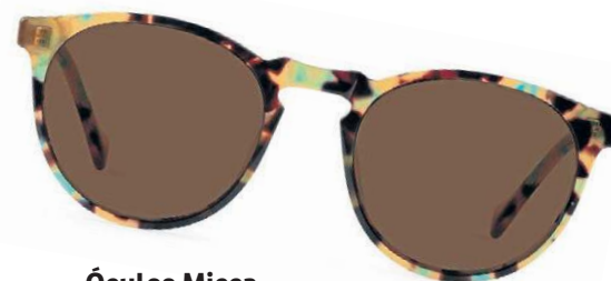
Óculos Micca, da Zerezes (R$ 395)