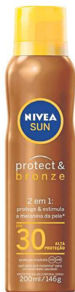
Sun Protect & Bronze Spray FPS 30, da Nivea (R$ 55)