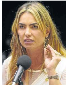
Ana Rayssa/CB/D.A.Press - 29/7/19

“O meu desejo é que 2022 seja o ano do começo de uma virada muito auspiciosa na nossa história, tanto no Distrito Federal quanto no Brasil. Que sejamos, novamente, uma referência positiva em diversas áreas, e que nossa sociedade possa ter mais justiça social, humanidade, alegria, generosidade, e oferecer uma vida digna e próspera para todos, sem exceção”