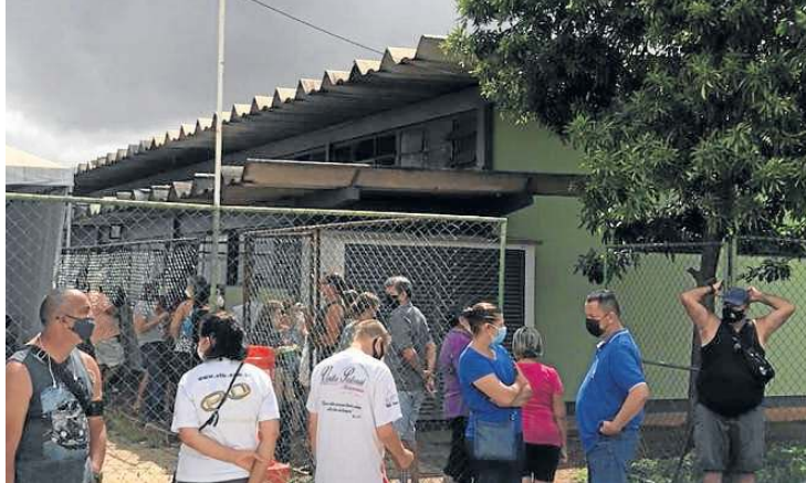
Material cedido ao Correio

Especialistas ressaltam que a vacinação diminui o risco