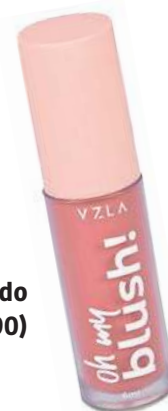
Blush Líquido Vizzela (R$ 34,90)