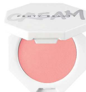
Blush cremoso Fenty Beauty, à venda na Sephora (R$ 129)