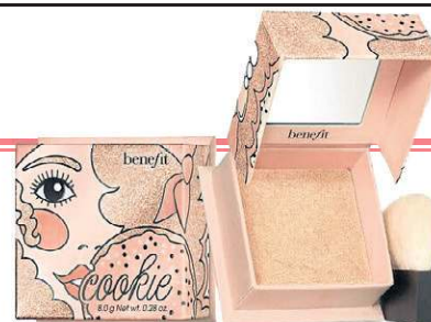
Iluminador Cookie, da Benefit, à venda na Sephora (R$ 184)

Há quem queira dar um toque a mais no cabelo. Nesse caso, Pri sugere uma trancinha de cada lado ou amarrações no estilo meio preso, atuais e superbonitas.