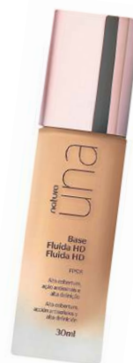
Base fluida HD FPS 15 Una, da Natura (R$ 108,50)