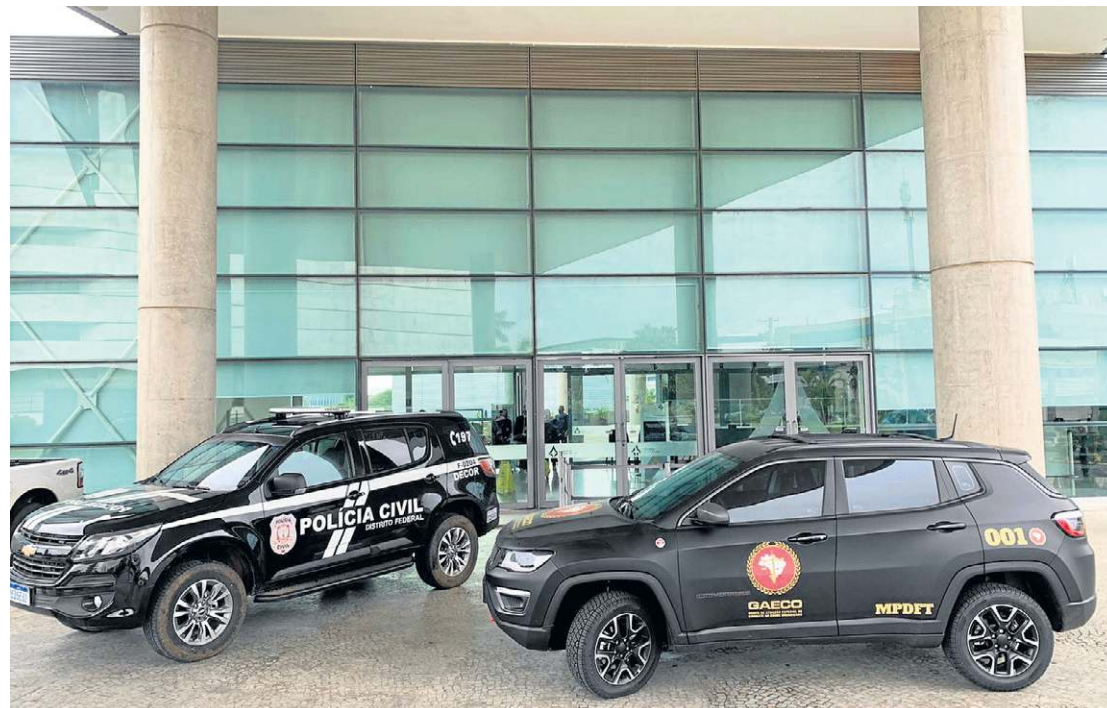
Pelo segundo dia consecutivo, investigadores da polícia e do MP estiveram na Câmara Legislativa