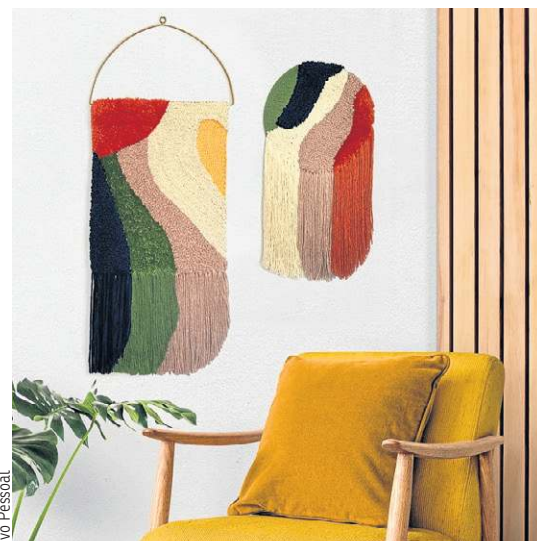
Peças únicas, produzidas à mão, por Mirna Linhares: decoração que foge do tradicional