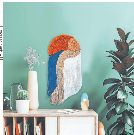
Peça feita por Mirna Linhares: combinação de cores