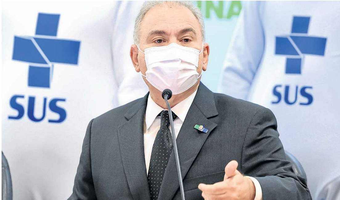
Queiroga: quantidade de vacinas é suficiente para aplicar em todos com mais de 18 anos

O Ministério da Saúde anunciou, ontem, a ampliação da aplicação da dose de reforço da vacina contra a covid-19 para toda população adulta do país. A nova orientação é de que pessoas com 18 anos ou mais procurem um posto de saúde para tomar a injeção adicional cinco meses após a aplicação da segunda do imunizante contra o novo coronavírus.