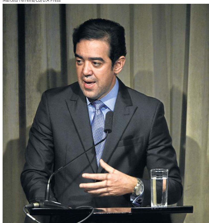
Para Dantas, operação ignorou boa gestão de verbas públicas