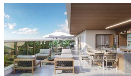
PERSPECTIVA DA CHURRASQUEIRA 01